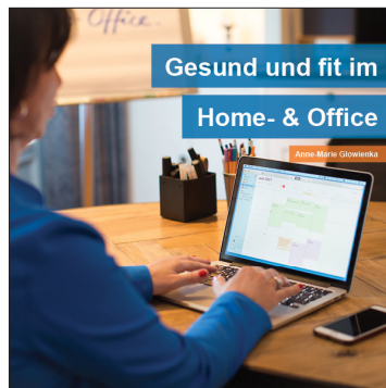
Das Buch mit Tipps, Checklisten und Übungen.